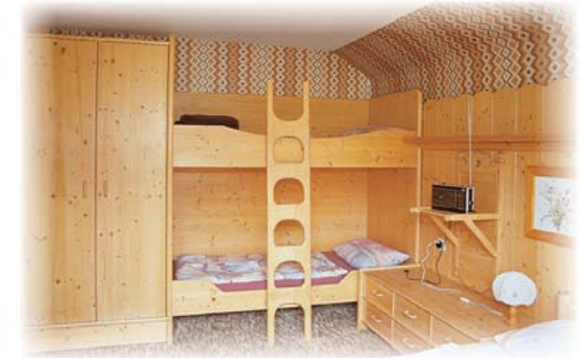
Großzügig eingerichtete Zimmer sorgen für Behaglichkeit

Das Heim wurde für die Jugend und Mitglieder zur Förderung des Ski-Sportbetriebes mit viel Liebe eingerichtet und ist das ganze Jahr über geöffnet. Für die Selbstversorgung steht eine großzügig eingerichtete Gemeinschaftsküche zur Verfügung. In 6 Schlafräumen können bis zu 48 Personen untergebracht werden. Um die Kosten des Heims zu decken, wird auch an Nichtmitglieder wie Familien, Vereine und Schulklassen vermietet.