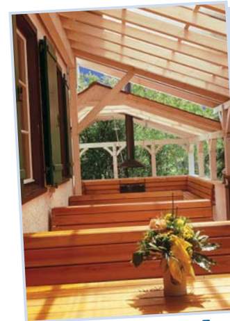
Gemütlicher Hock im Freien