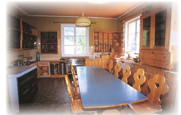
Die Küche bietet alle notwendigen Einrichtungen