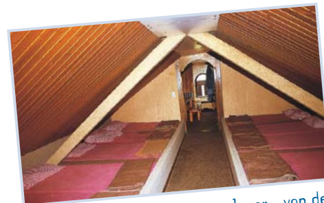
Das Matrazenlager - von der Jugend bevorzugt