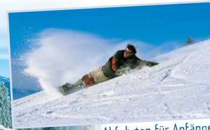
Abfahrten für Anfänger und Könner