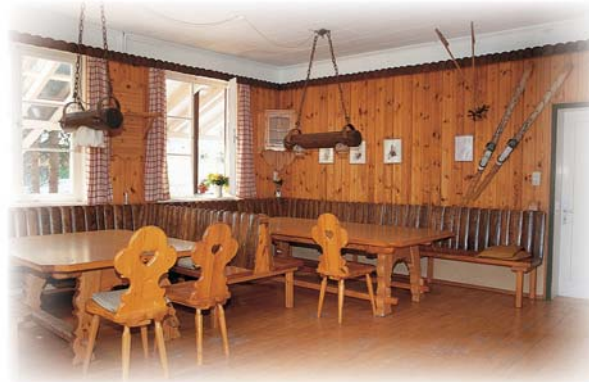
Im Aufenthaltsraum ist genügend Platz für alle Übernachtungsgäste